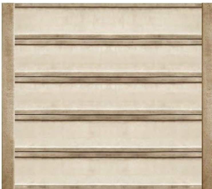
Imagine gard din beton armat

(imagine cu titlu de prezentare – panourile pot avea modele diferite)